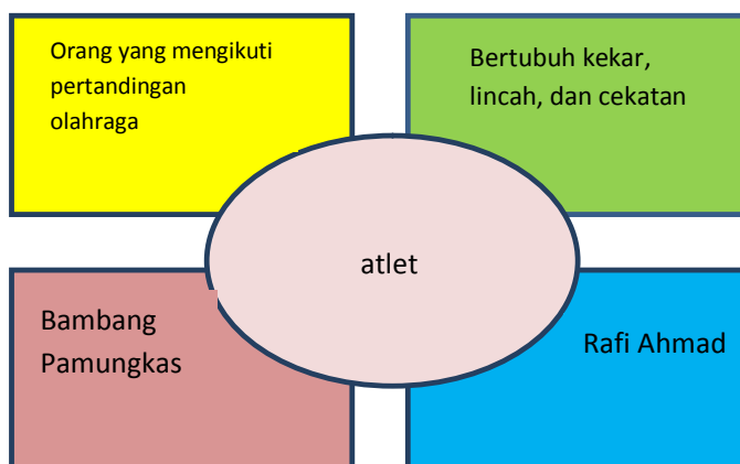
Gambar 2. Contoh Penerapan Model Frayer