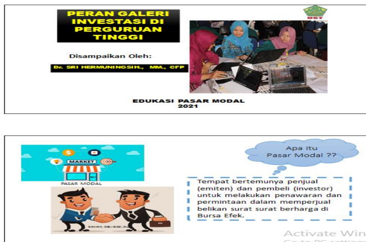
Gambar 2. Materi Peran Galeri Investasi

nabung saham. Peran Galeri Investasi Galeri investasi membawa peran penting dalam dunia akademisi sebagai sasaran galeri investasi yaitu untuk menjangkau kalangan berpendidikan agar lebih mengenal dan memahami dunia pasar modal sehingga perguruan tinggi dapat mencetak masyarakat akademisi yang paham akan teori juga praktiknya.