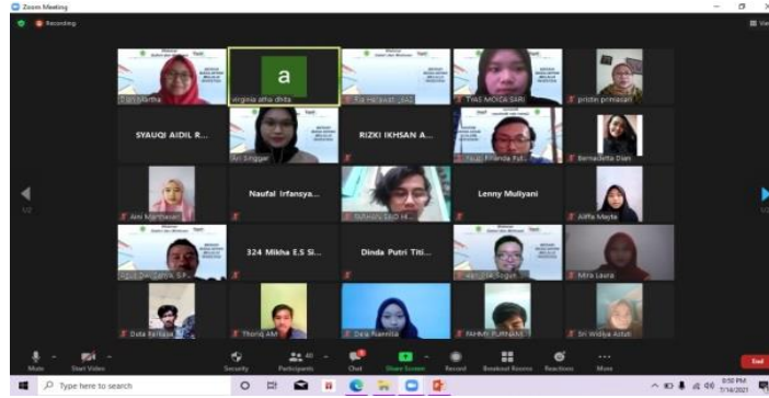
Gambar 6. Foto Peserta