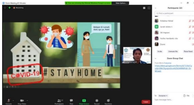
Gambar 4. Pelatihan Sesi kedua

Pada gambar 3 dapat dilihat tim pengabdian kepada masyarakat yang merupakan Dosen dari Universitas Indraprasta PGRI.