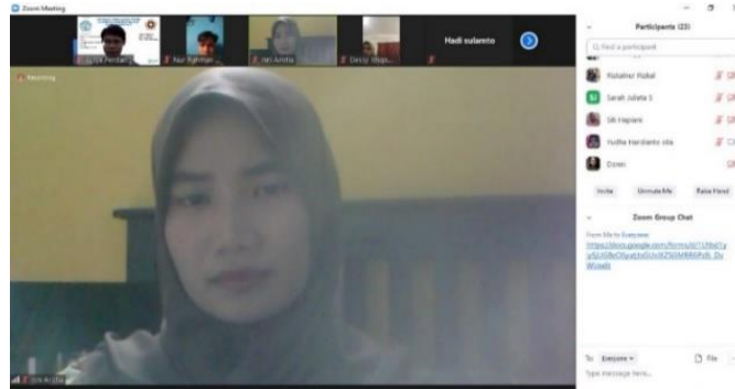
Gambar 1. Sambutan perwakilan Bimbingan Belajar Gama UI Duren Tiga

pengajar dan karyawan Bimbingan Belajar Gama UI Duren Tiga secara daring (Gambar 1 dan 2).