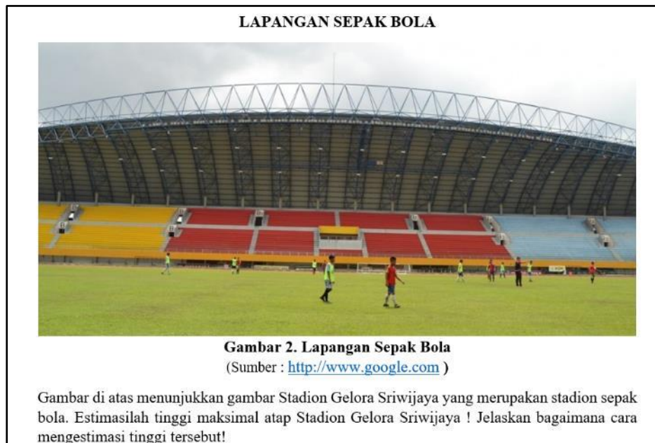
Gambar 2. Prototype 2

Komentar ini dijadikan pertimbangan untuk merevisi prototype I. Berdasarkan proses validasi pada tahap expert review dan one to one , maka soal tetap dipertahankan hanya saja untuk rubrik penskoran diperbaiki sesuai dengan saran expert menggunakan rubrik penskoran PISA. Untuk saran siswa menambahkan skala tidak diterima dengan alasan apabila ditambahkan informasi akan merubah prediksi level dan tidak sesuai dengan framework PISA. Berikut ini soal yang telah di revisi, dihasilkan prototype II dan akan divalidasi pada tahap small group seperti diperlihatkan pada Gambar 2.